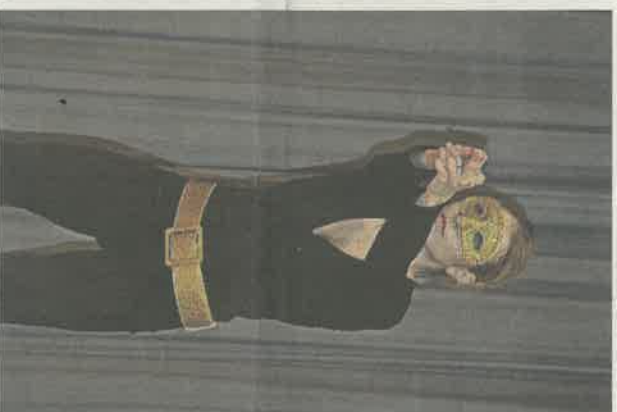
Ein Bondgirl in Action.