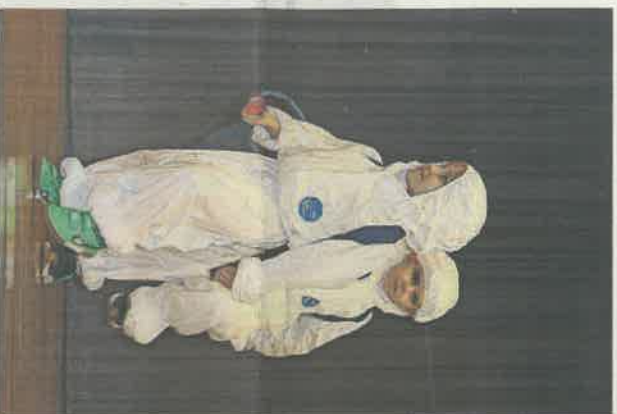
Die KiTu auf Geisterjagd.